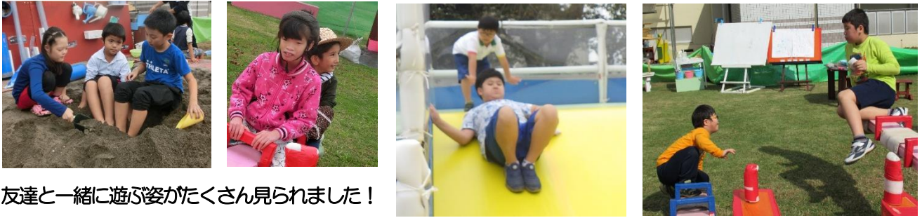
友達と一緒に遊ぶ姿がたくさん見られました！