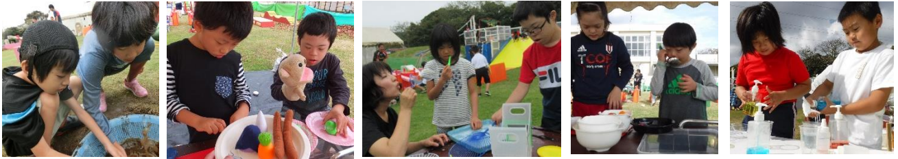
「芸術の秋」にふさわしく、工作したり、絵を描いたり…