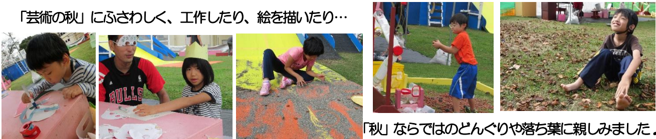
「秋」ならではのどんぐりや落ち葉に親しみました♪